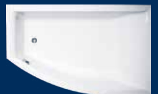
VIGGA ASSYMETRISK H/V