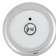
C 3 S