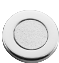
C 1 / C 2

x: Standard udstyr o: Mulighed for fabriksmonteret ekstra udstyr