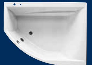
THILDE ASSYMETRISK H/V